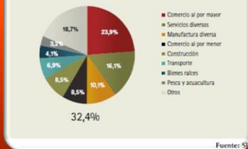
Composición de los ingresos de las empresas pequeñas por sector

En Ecuador según el INEC – SENPLADES 2011 se contabilizaron 704.556 empresas.