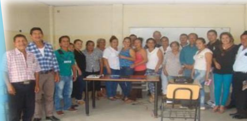
Grupo Suplente No 2