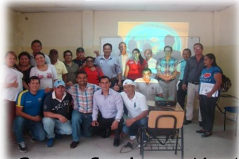
Grupo Suplente No 1