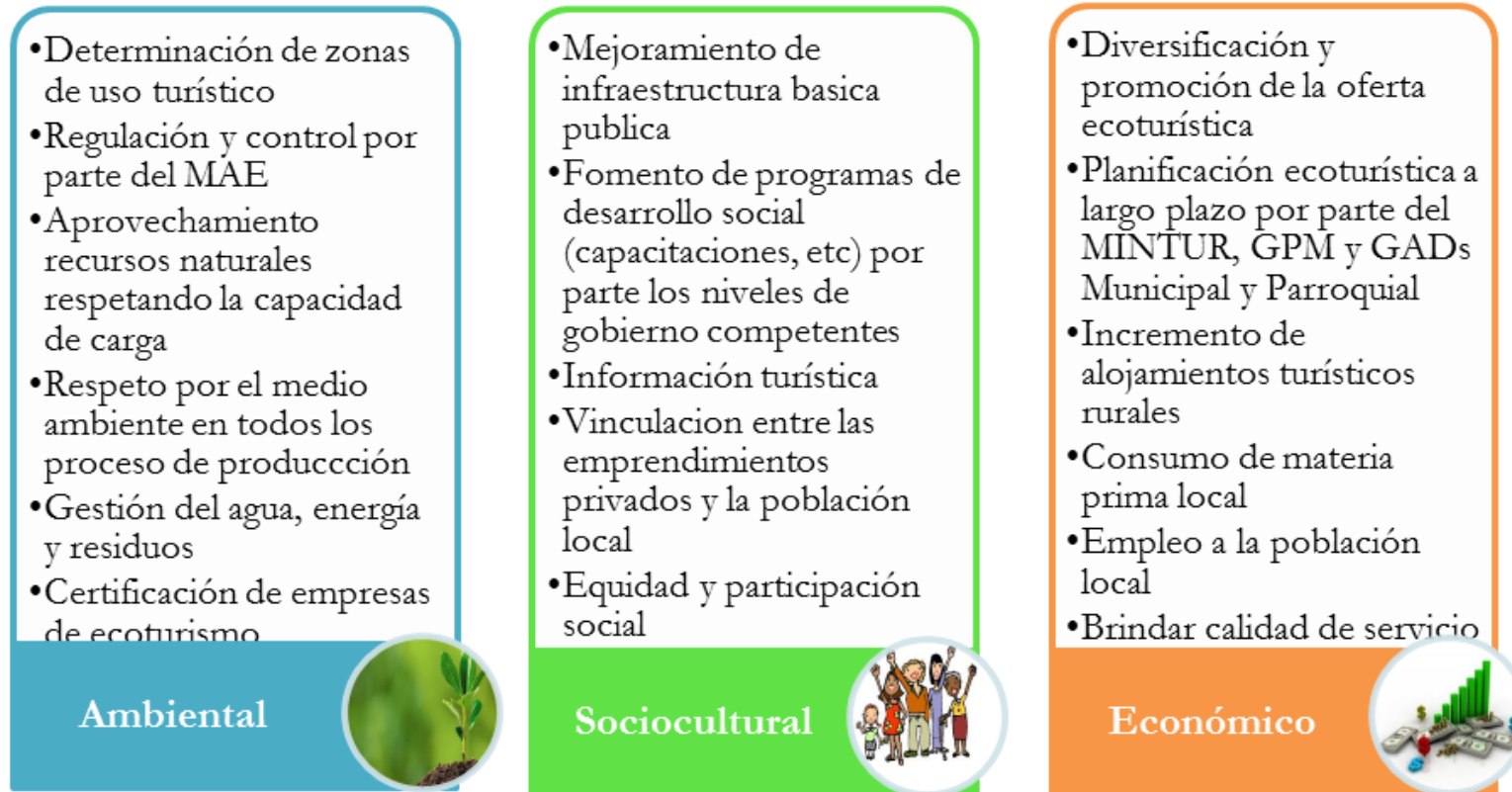
Tabla 3. Modelo de gestión sostenible