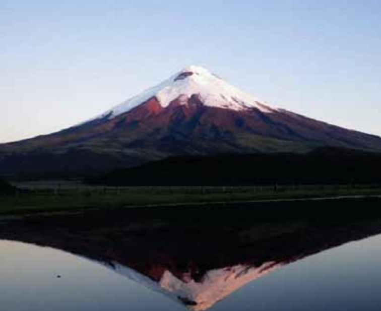
Parque Nacional Cotopaxi