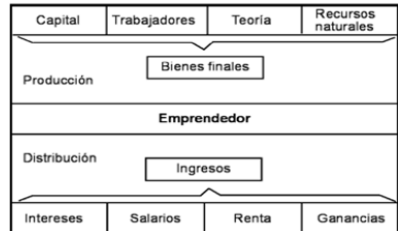
Fig1. El Emprendedor como agente central del mundo económico.

Fuente: (Tarapuez Chamorro, 2007, p. 42).