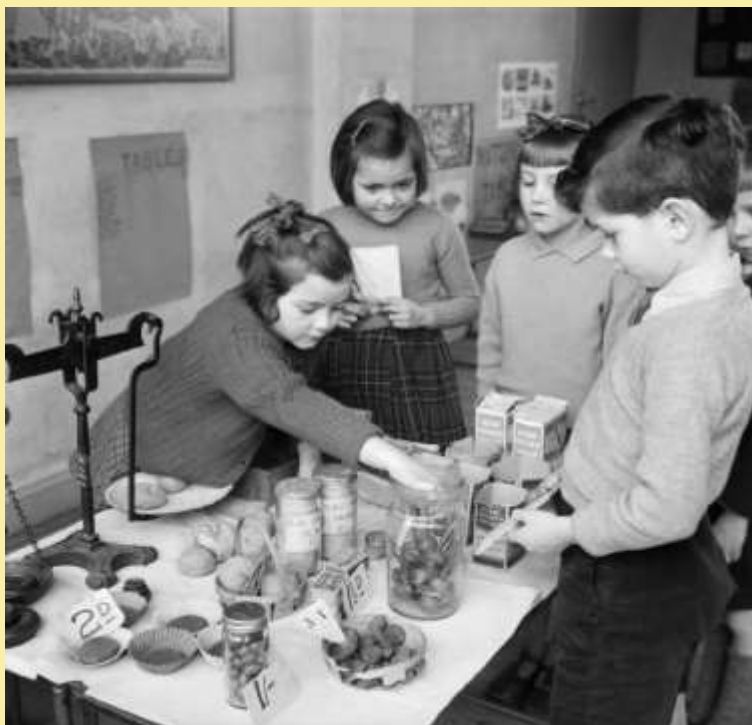
Esta foto de Autor desconocido está bajo licencia CC BY-SA