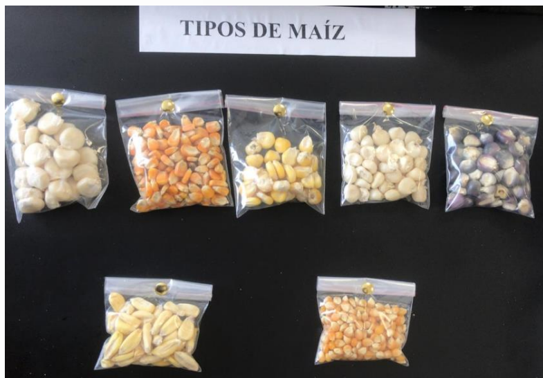
TIPOS DE MAÍZ