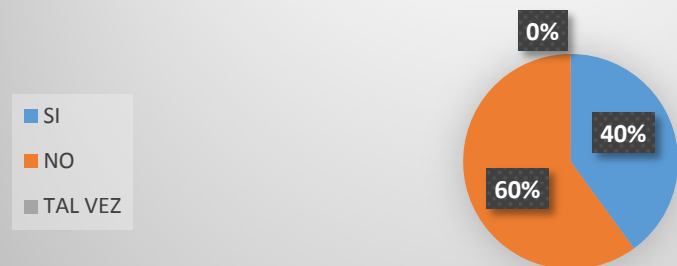
Grafico 2. USTED REALIZA ADAPTACIONES CURRICULARES A ESTUDIANTES QUE PRESENTEN NEE

Se observa mediante la encuesta realizada que el 40% de las docentes realiza adaptaciones curriculares.