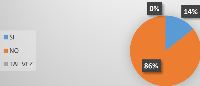
Grafico 3. USTED CONOCE UN LENGUAJE ALTERNATIVO DE COMUNICACIÓN (LENGUAJE DE SEÑAS, SISTEMA BRAILLER, SORDO SEGUERA, METODO...

Dentro del CEI Ternuras solo el 14% del personal conoce un lenguaje alternativo.