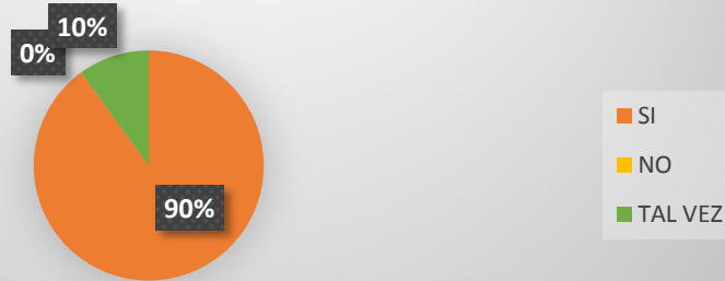
Grafico 1. CONSIDERA USTED LA OBLIGATORIEDAD DE LA INCLUSIÓN DESDE LA EDUCACIÓN INICIAL

El 90% de las docentes del CEI Ternuras afirmo la importancia de la inclusión en el campo de trabajo.