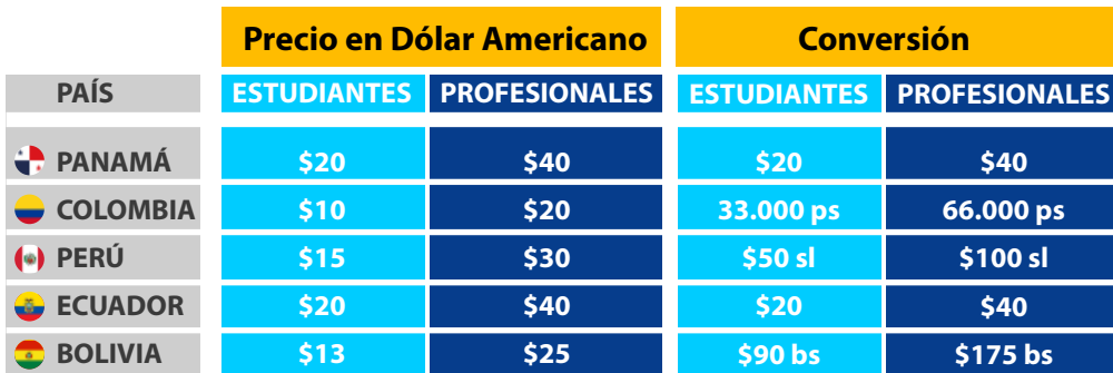
Tabla de costos para Ponentes